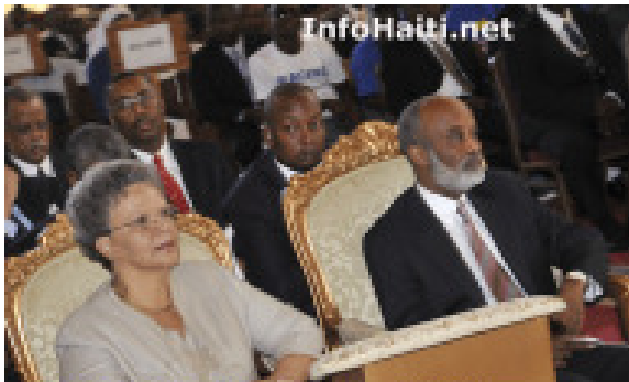
Le Président René G. Préal et la Première Ministre Michèle Duvivier Pierre-Louis aux Gonaïves le 1 er janvier

Dans son discours à l'occasion des cérémonies marquant le 205 ème anniversaire de l'Indépendance d'Haïti, le Chef de l'Etat a soutenu que 2008 a été une année difficile notamment sur le plan économique. Il a rappelé les manifestations contre la cherté de la vie et le passage de 4 ouragans dévastateurs.