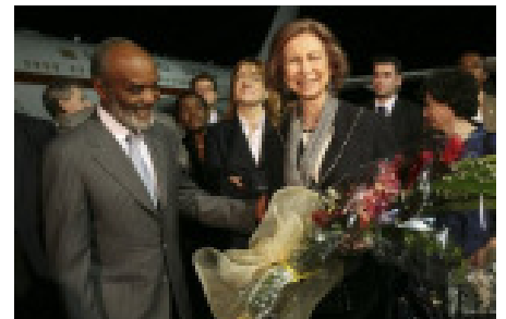
Le Chef de l'Etat accueille la Reine Sofia à sa descente d'avion