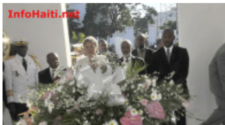
A la Place des Aïeux ce 2 janvier : le Chef de la PNH, le Président de la Cour de Cassation, la Première Ministre, le Chef de l'Etat, et le Président du Sénat

Le Président Préal a mis en garde contre une détérioration du secteur