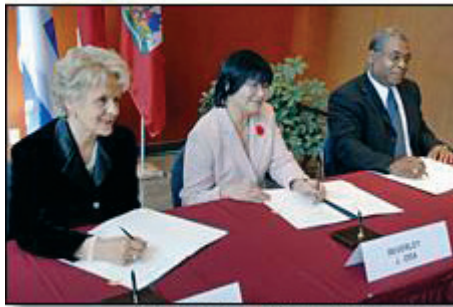
Mme M. Gagnon-Tremblay, Mme B. J. Oda et le Ministre Jean-Max Bellerive

Monique Gagnon-Tremblay, également ministre responsable de la Francophonie, s'est réjouie que la situation sécuritaire du pays se soit améliorée.