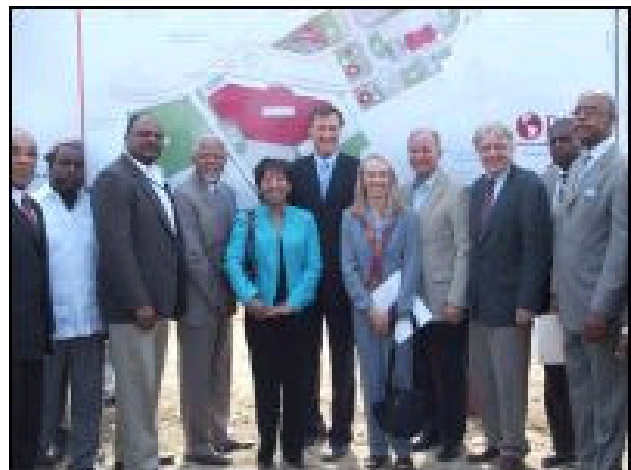
Les officiels haïtiens et canadiens

Consulat Général de la République d'Haïti à Chicago