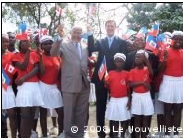
Le Chancelier haïtien, Jean Rénald Clérisme et son homologue canadien, Maxime Bernier, entourés d'enfants, se partageant les drapeaux des deux États