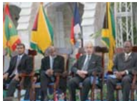
Le Président Préal au Sommet de la Caricom.

Le maintien de la ligne aérienne caribéenne LIA, confrontée à de graves difficultés financières, a constitué un sujet de préoccupation pour les leaders de la CARICOM. Ils veulent empêcher la disparition de cette compagnie qui as-